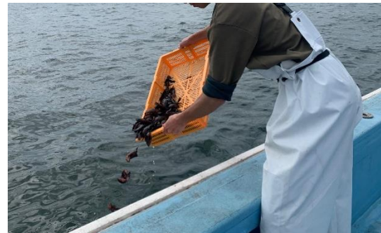
【いざ放流!! 大きくなるんだよ!!】