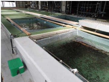
【小割生簀にいたるキジハタ】

令和6年4月16日（火）～4月24日（水）にキジハタの稚魚（サイズ：全長100ミリ）8万尾を大阪府沿岸海域20か所に放流しました。当初放流数は6万尾を予定していましたが、予想以上に生残率が高かったため、各箇所の放流数を3,000尾から4,000尾に変更しました。