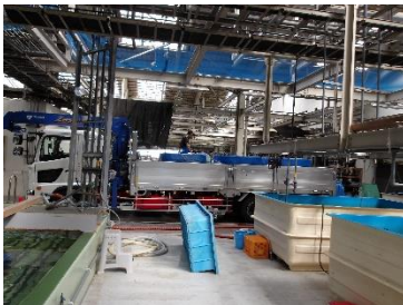
【トラックへ水槽を積み出発】