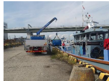
【港からは船で放流場所へ】