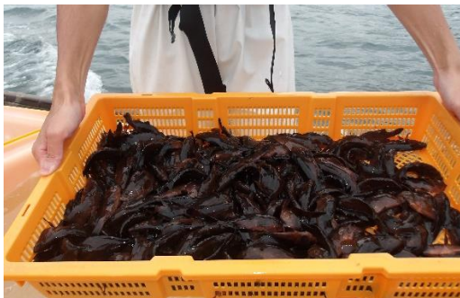
【カゴに入れた放流直前のキジハタ】