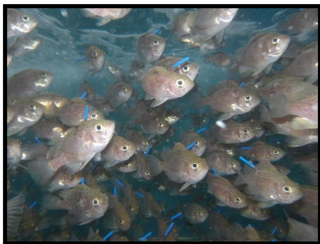
標識装着後も元気に泳いでいました