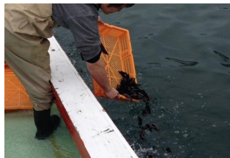
【キジハタの放流風景】